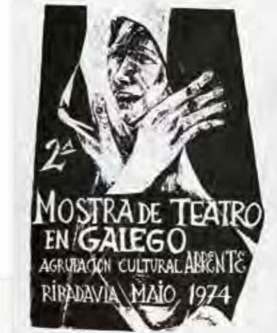
Carteis da Mostra de Teatro Galego de Ribadavia, organizada por Abrente (1974), e do Festival Folk Galego, organizado polo Galo e polo Facho en 1975