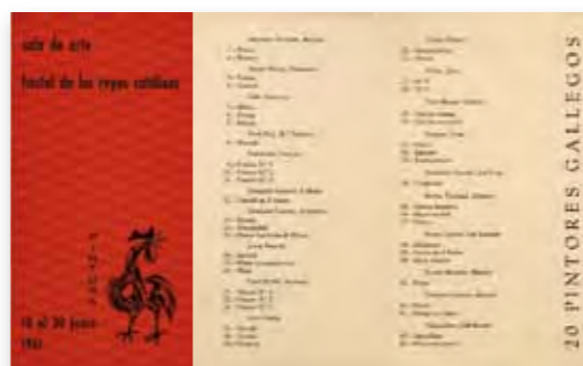
Díptico da mostra 20 pintores gallegos , primeira actividade cultural organizada polo Galo (xuño de 1961)

das en Compostela na segunda metade da década dos cincuenta. Nese escenario dificultoso pero cada vez máis aberto á práctica cultural pensada e feita en galego, foron aparecendo as primeiras agrupacións culturais que son obxecto central desta mostra. A primeira en Santiago de Compostela no ano 1961 co nome de O Galo, que foi a que tentou abrir camiños que moi logo habían seguir outros colectivos, bautizados con nomes aurorais, dispostos a cambiar a paisaxe cultural e canda ela a imaxe, a conciencia e a proxección do país. De todo iso e moito máis trata a exposición O asociacionismo cultural en Galicia (1961-1975) , que o Consello da Cultura Galega promoveu e organizou ao se cumpriren cincuenta anos daquele primeiro paso imprescindible para outras transformacións e avances. Mesmo para a democracia e a autonomía, que daquela eran apenas visibles entre tanta bretemosa lonxanía . Mais algo viña movéndose naquel tempo de sombras e unha das probas está aquí, nesta mostra que detalla o