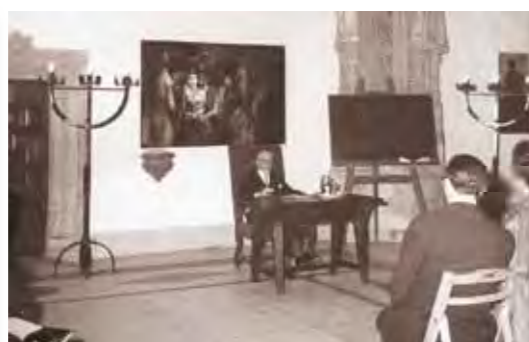
Conferencia de Vicente Risco «Galicia y la revolución estética», no Hostal dos Reis Católicos e mecanoscrito orixinal da conferencia, organizada polo Galo en 1961