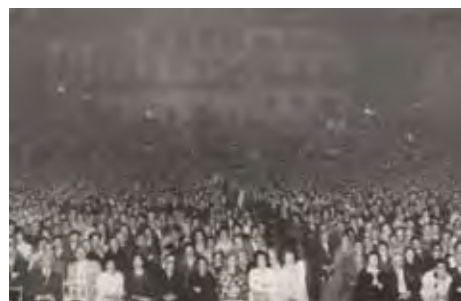
Pasquín e fotografía da representación de Os vellos de Castelao na praza da Quintana (Santiago, 1961)