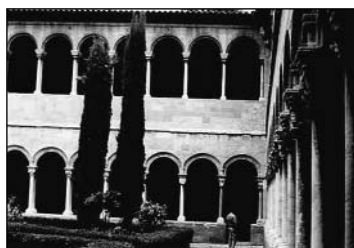
Santa María de Ripoll