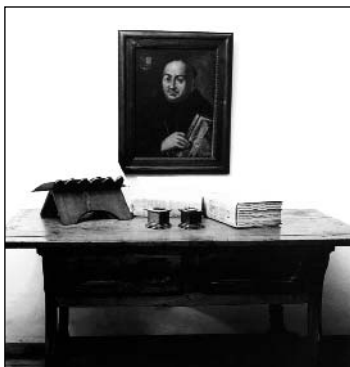
Autógrafo, retrato e escritorio de Martín Sarmiento

hace tiempo si hubiese hallado arbitrio para saber que en esto no había de disgustar al Rey ni había de ser de su desagrado que a mi ciega y pronta obediencia en aceptar le siguiese después una espontánea y sincera renuncia, originada de mi propio conocimiento y de la reflexión sobre las cargas de la dicha abadía.